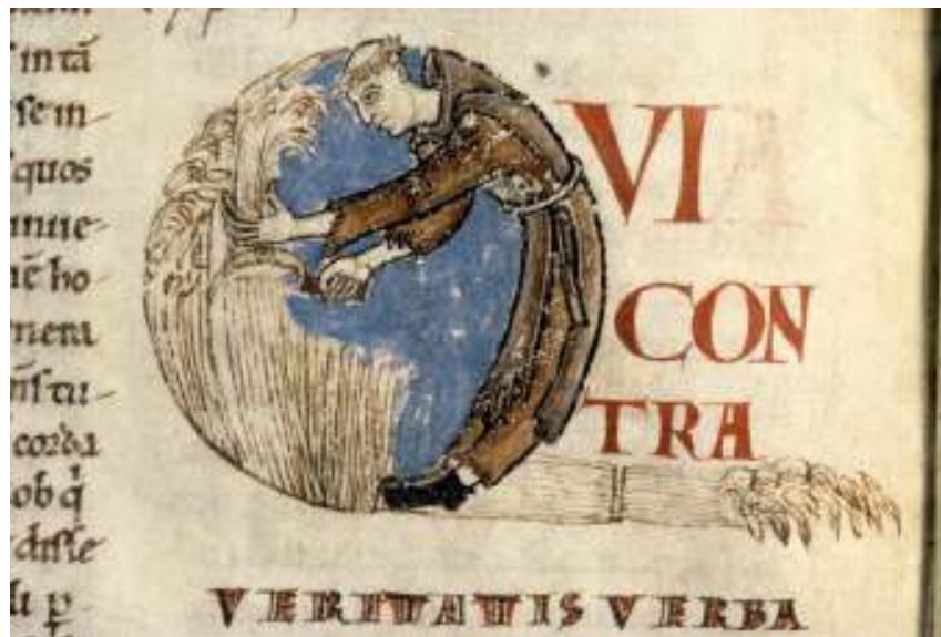
(manuscrito Dijon, Bibliothèque Municipale, 170, f. 75v)

Em consonância com os propósitos que norteiam o trabalho do LATHIMM, o encontro tem por objetivo principal promover o diálogo entre a reflexão teórica e a práxis historiográfica no campo específico da imagem medieval. O pressuposto definidor do trabalho é o de que não há nem independência nem prioridade entre as instâncias teórica e histórica. Ao contrário, diante do perigo da alienação mútua entre essas instâncias, como lembra Georges Didi-Huberman, “a prática salutar [é] dialetizar.”